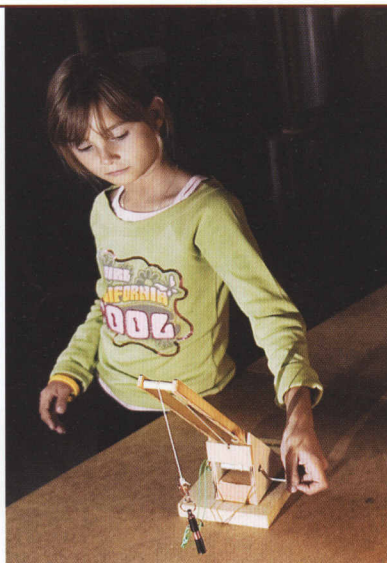
Elev trodsr tyngdekraften.

Så nu troner historiske måleinstrumenter med ukurante